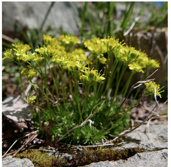
La Drave faux aïzoon