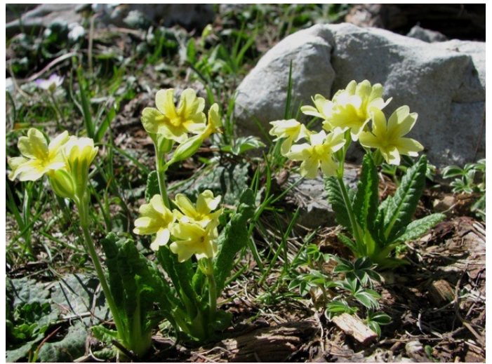
La Primevère intriquée