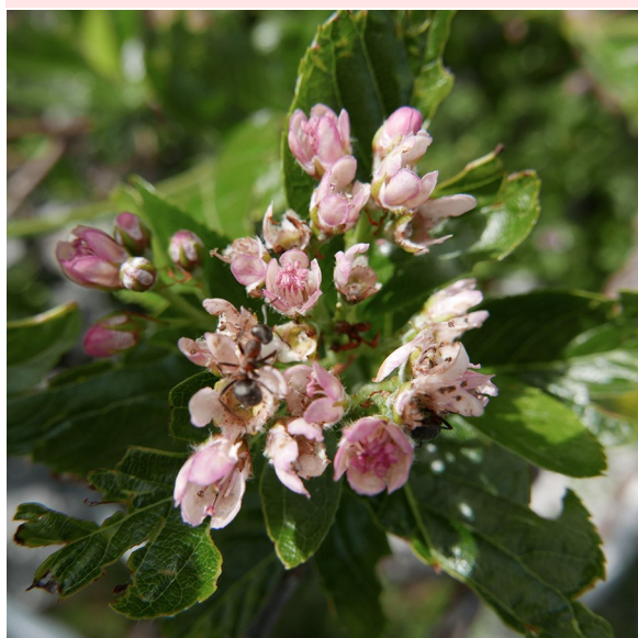
L'Alisier petit-néflier Sorbus Chamaemespilus