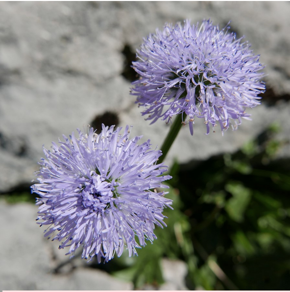
La Globulaire à tige nue Globularia nudicaulis

Le long du parcours, voici nos rencontres dans l'ordre d'apparition à l'écran :