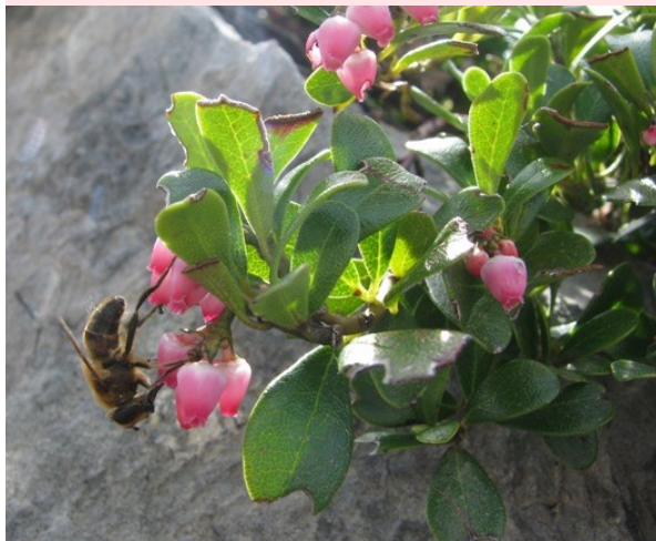
Le Raisin d'ours Arctostaphylos uva-ursi