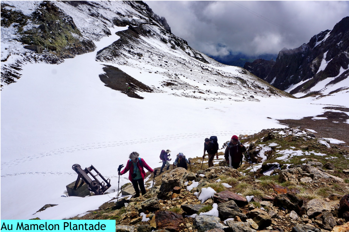
Au Mamelon Plantade

Puisqu'on ne peut pas faire le tour du lac, nous nous dirigeons vers le Mamelon Plantade. Pour cela nous revenons en arrière pour prendre le chemin de l'Observatoire jusqu'au col de Sencours.